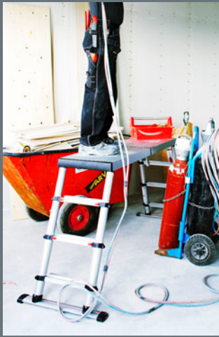
Plate-forme de travail télescopique